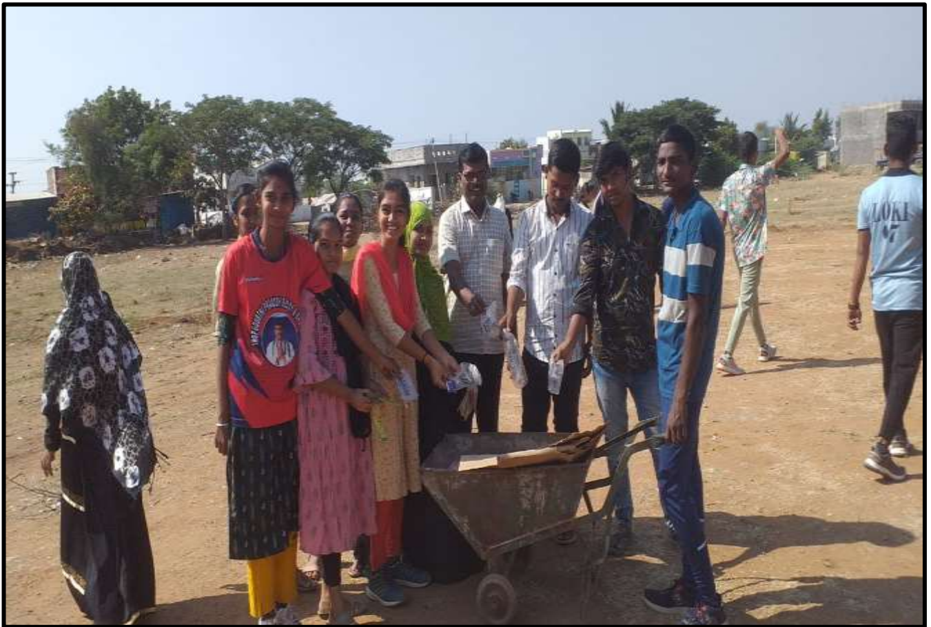
As part of Academic Activities, the Department of NSS Celebrated participated Staff and Students. Awareness programme on 'Campus Cleaning'.