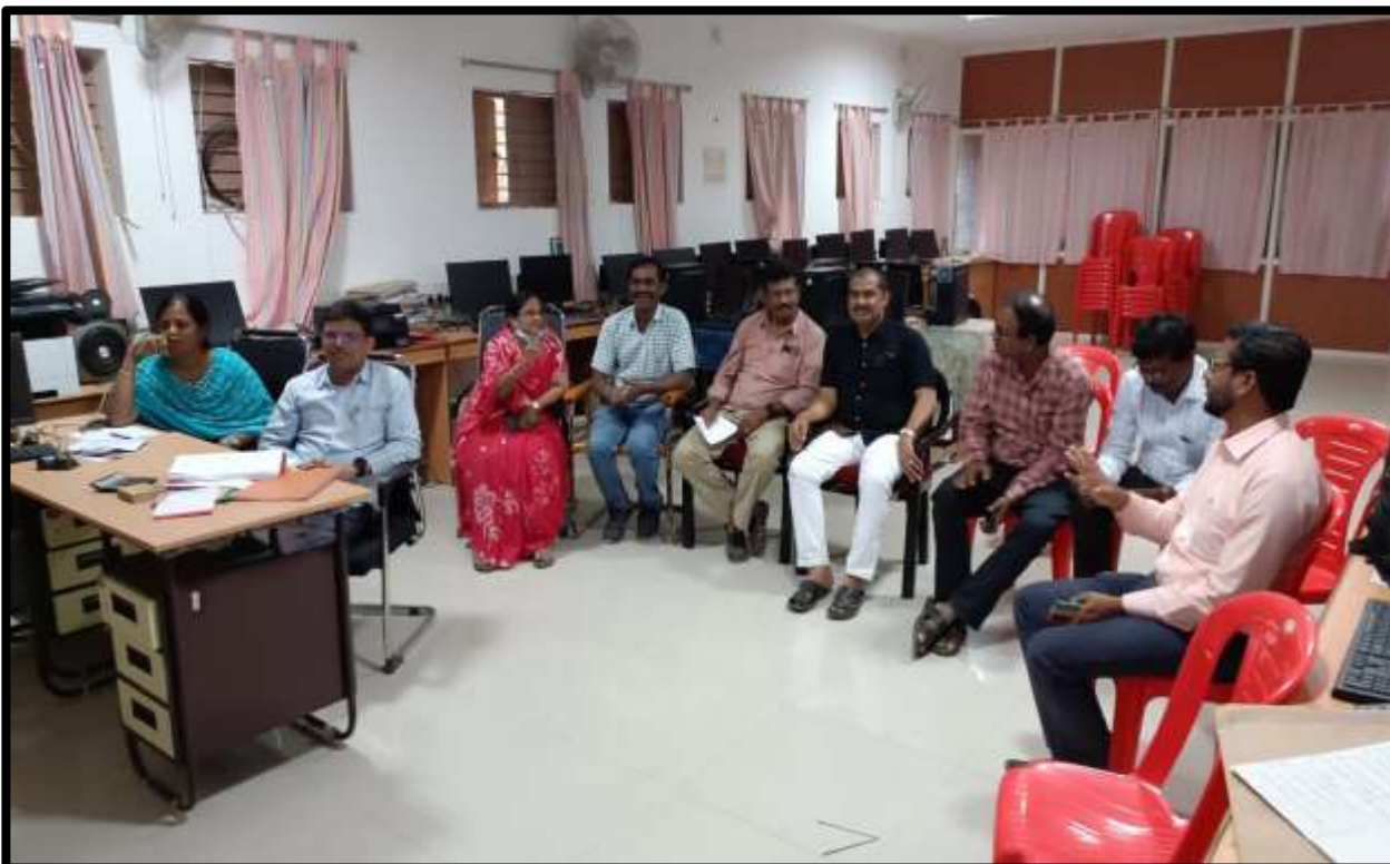
Review meeting on NAAC Criteria –III records preparation