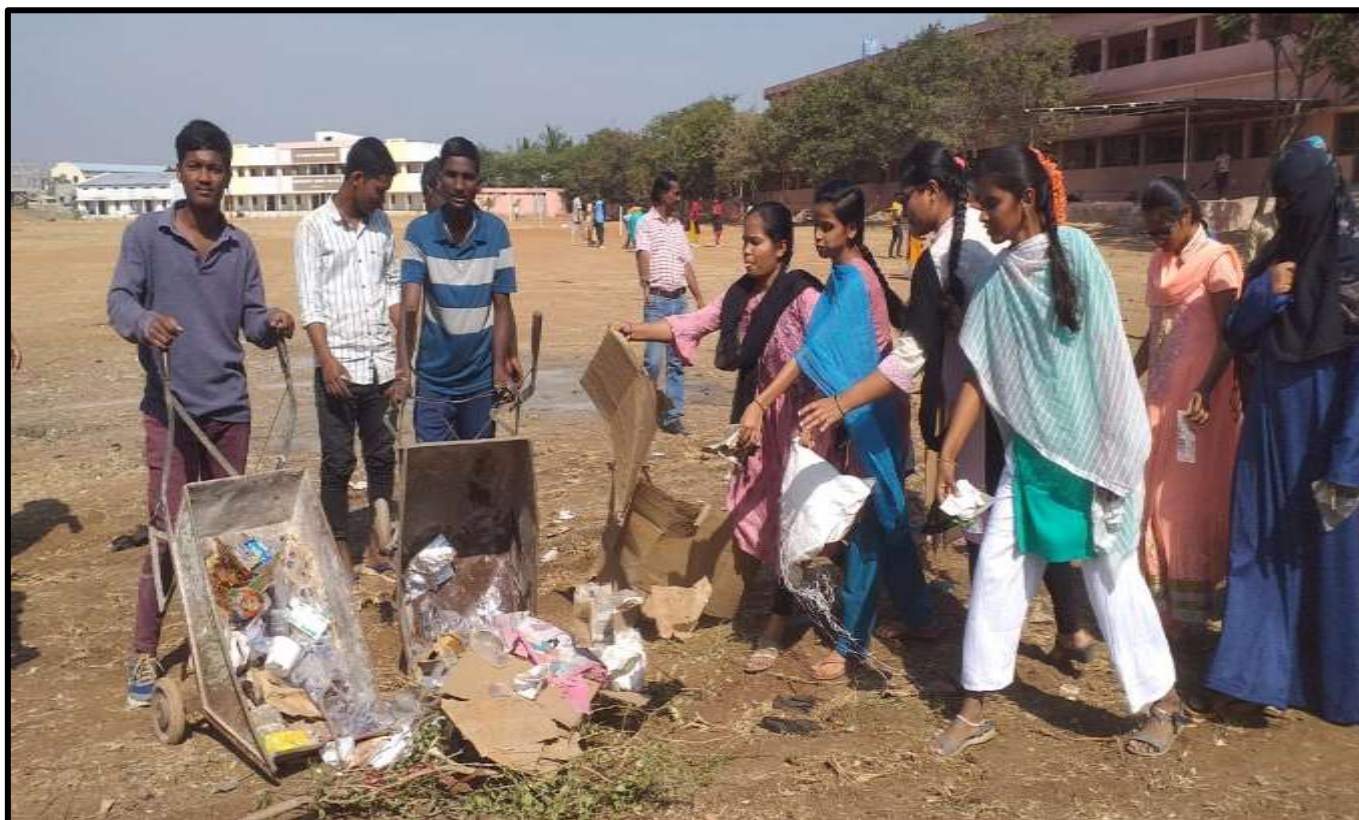
Campus Cleaning by NSS Students